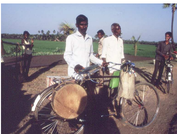
Evangelist met fiets en trommel, India