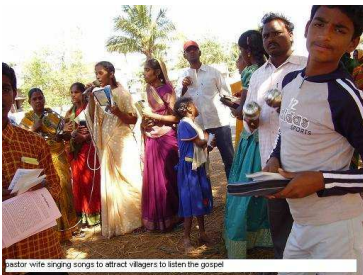
Zingen tijdens evangelisatie, India