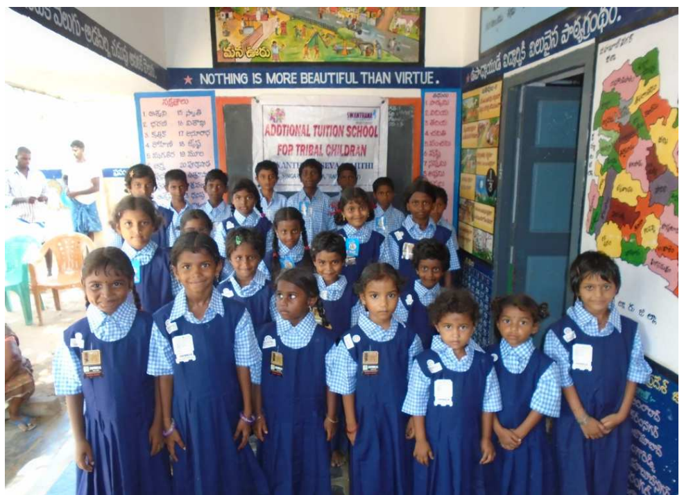
Kinderen van het bijles project India.